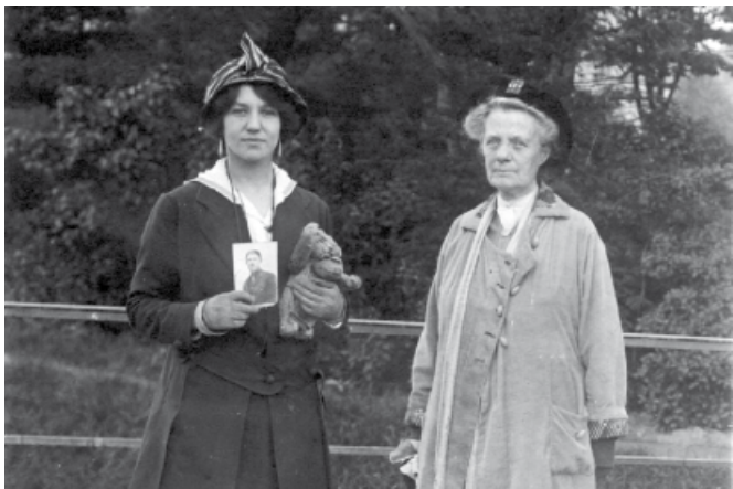
Hope Mirrlees (izq.) y Jane Ellen Harrison (der.), 1915.