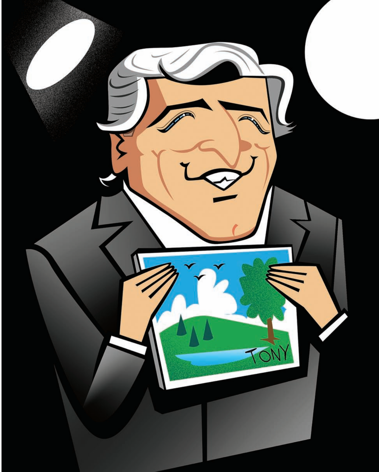
T O N Y B E N N E T T CANTANTE