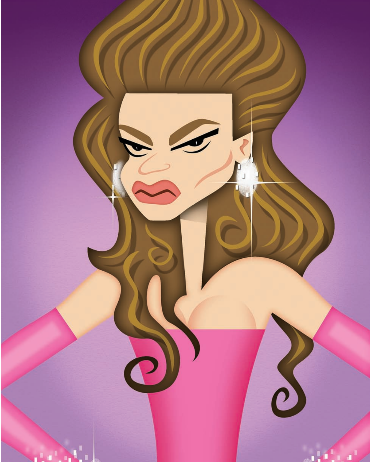
S A N D R A B E R N H A R D H U M O R I S T A