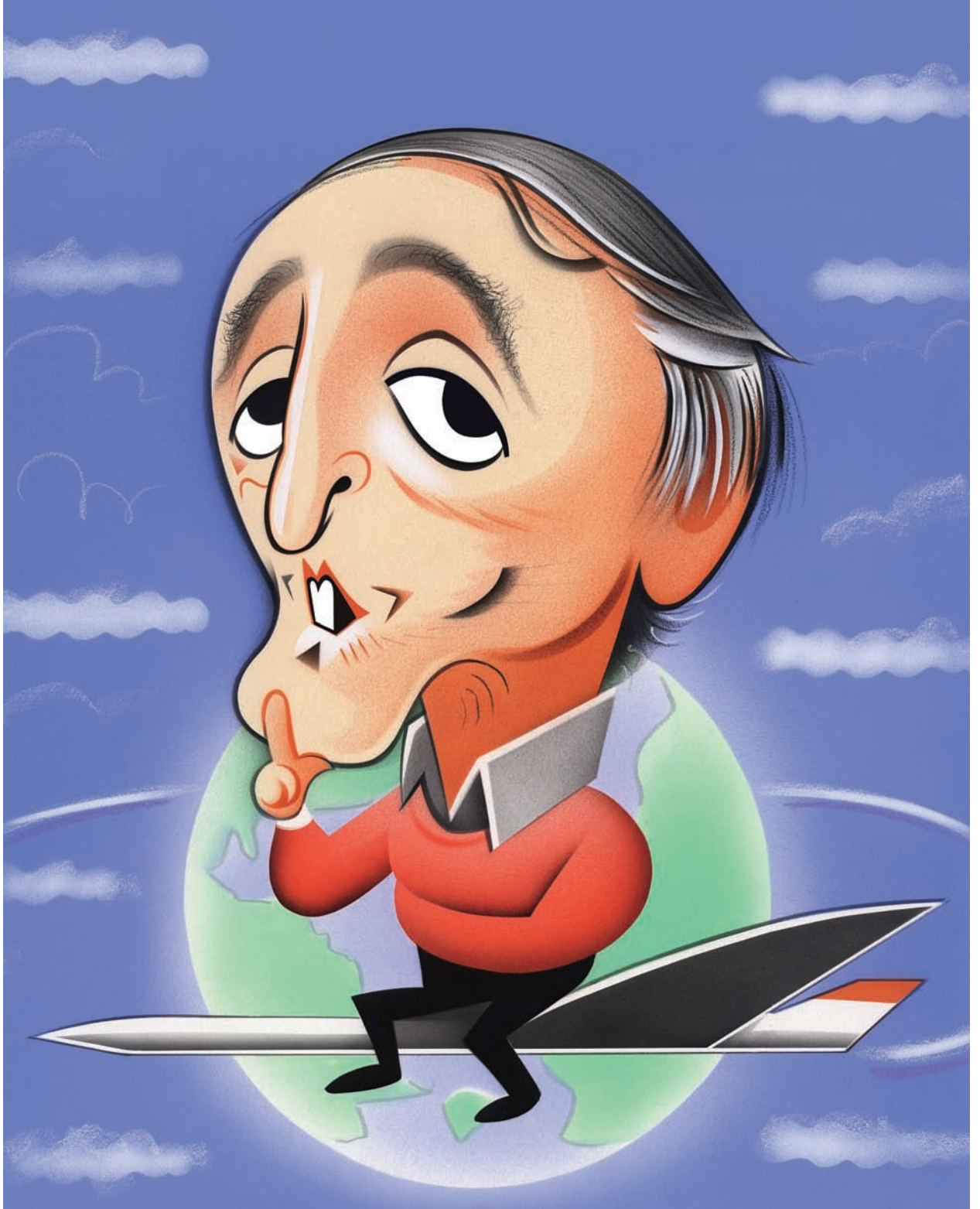
WILLIAM F. BUCKLEY JR. ESCRITOR Y DIRECTOR DE NATIONAL REVIEW