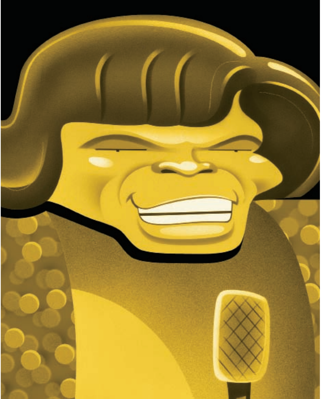
J A M E S B R O W N MÚSICO