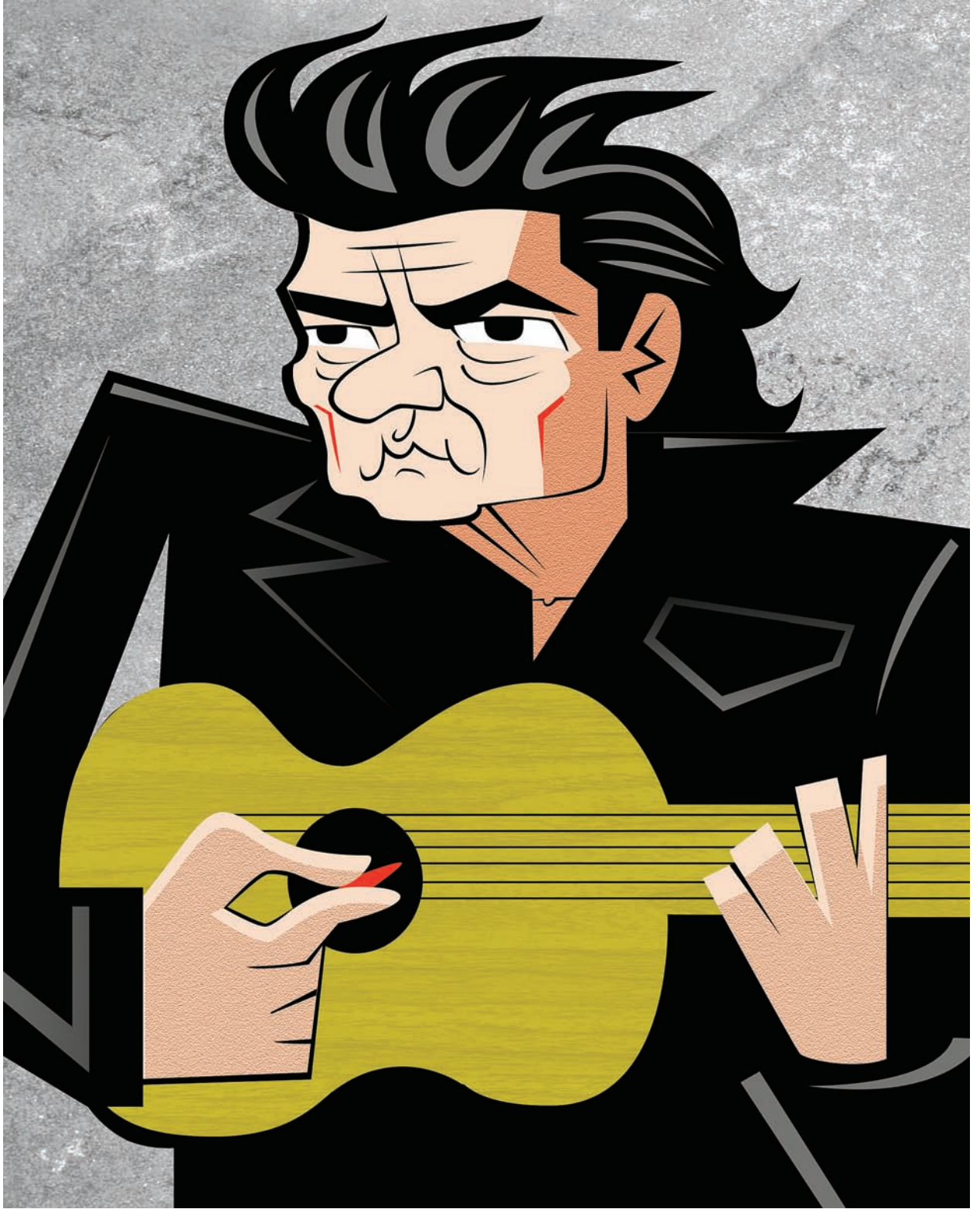
J O H N N Y C A S H MÚSICO