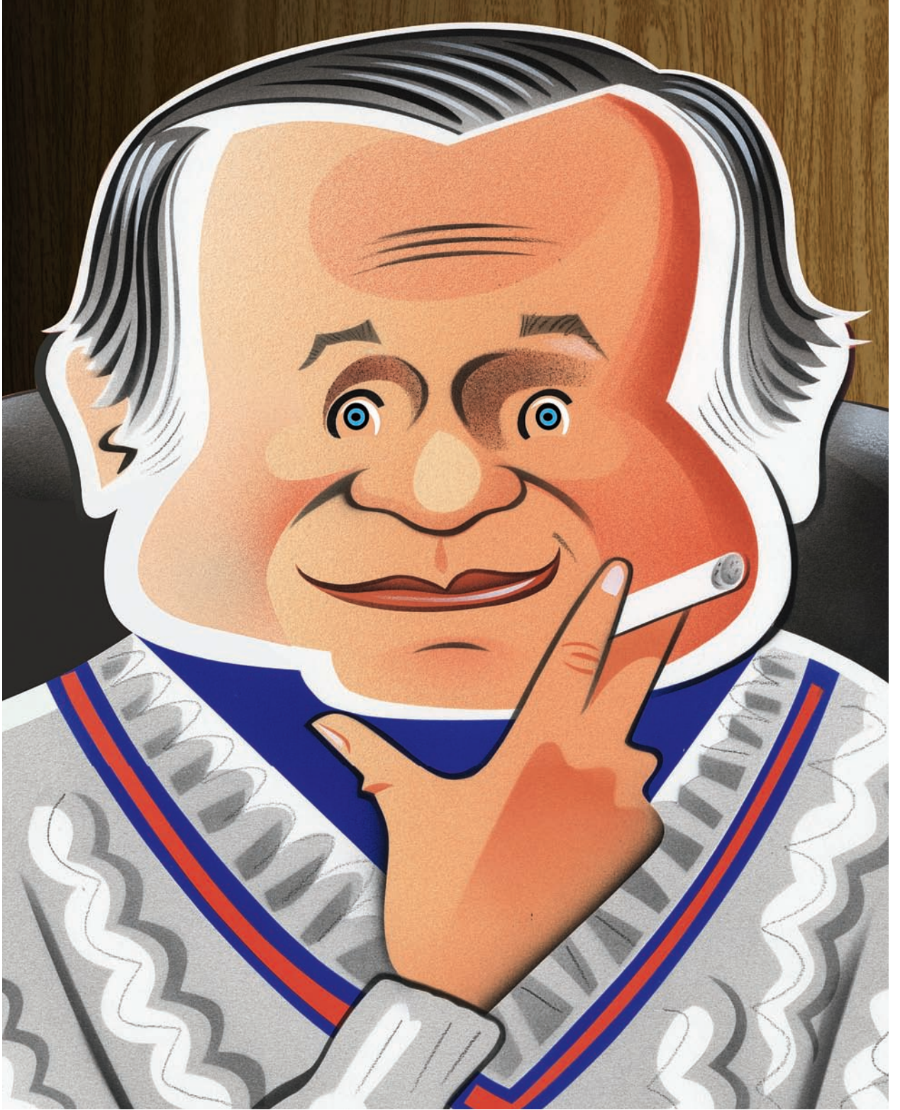
B I L L B L A S S DISEÑADOR DE MODA