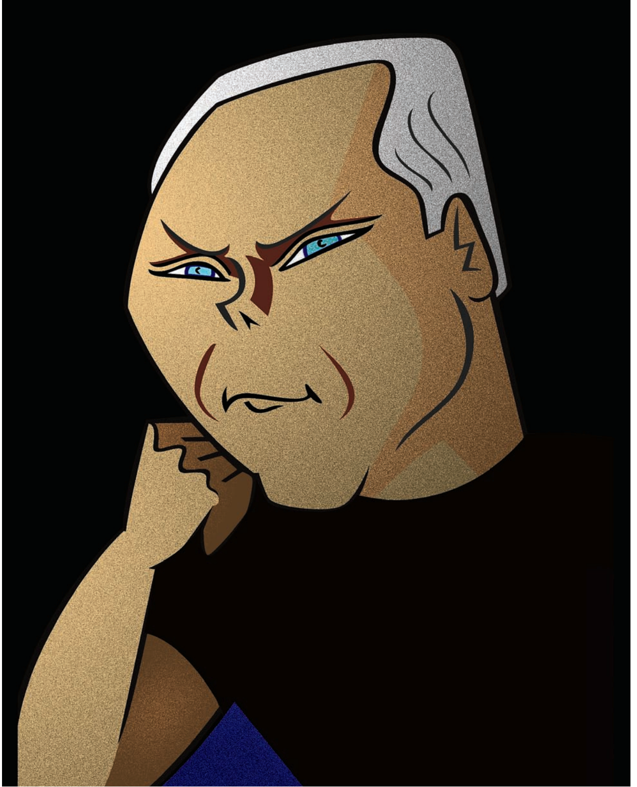
GIORGIO ARMANI DISEÑADOR DE MODA