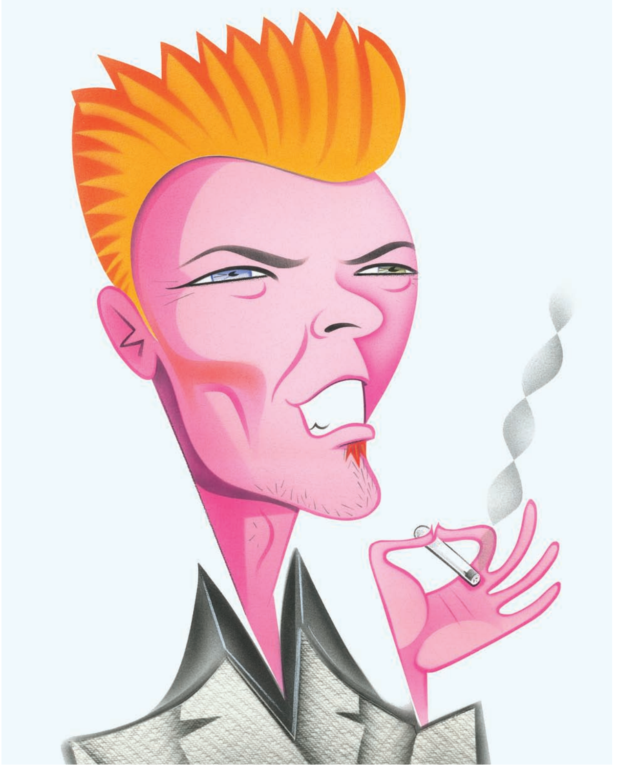
DAVID BOWIE MÚSICO