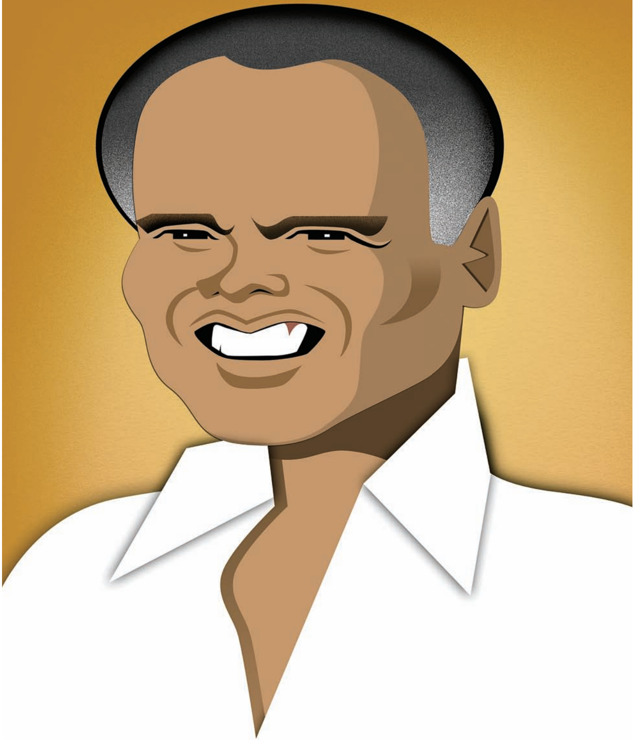
H A R R Y B E L A F O N T E ARTISTA Y ACTIVISTA PRO DERECHOS CIVILES