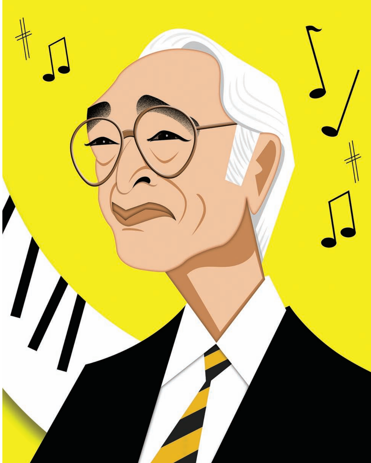
D A V E B R U B E C K PIANISTA Y COMPOSITOR DE JAZZ