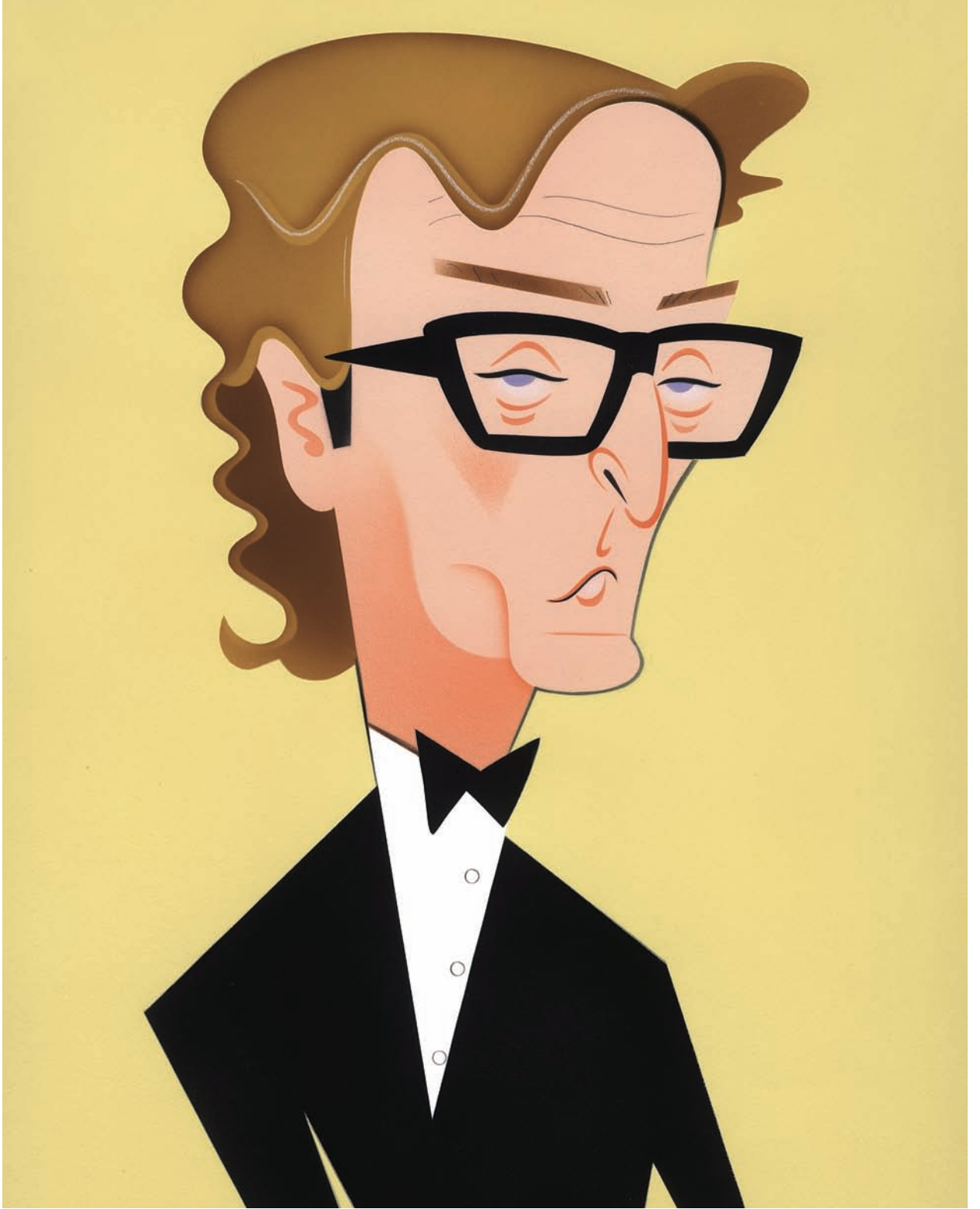
S I R M I C H A E L C A I N E A C T O R