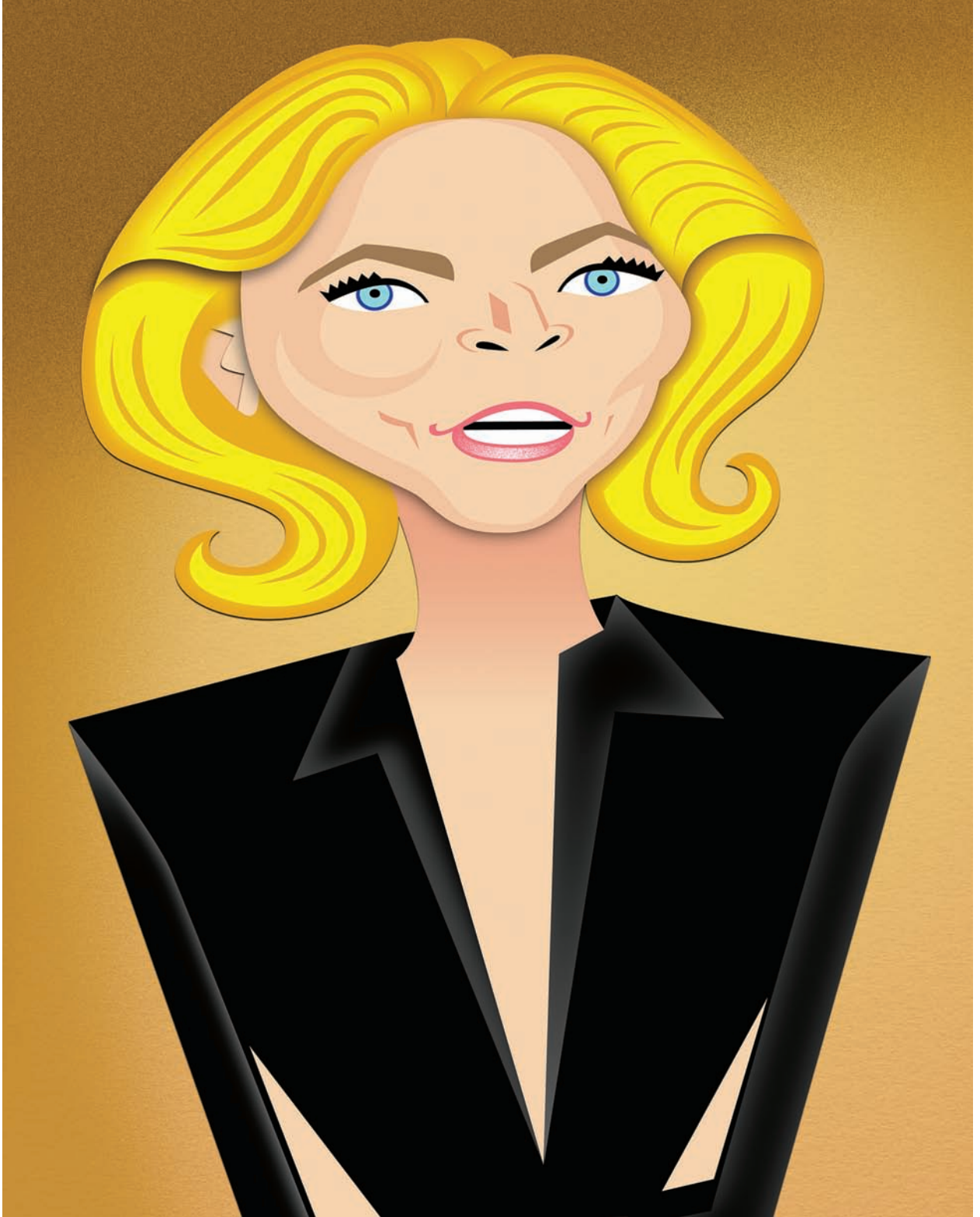
L A U R E N B A C A L L ACTRIZ