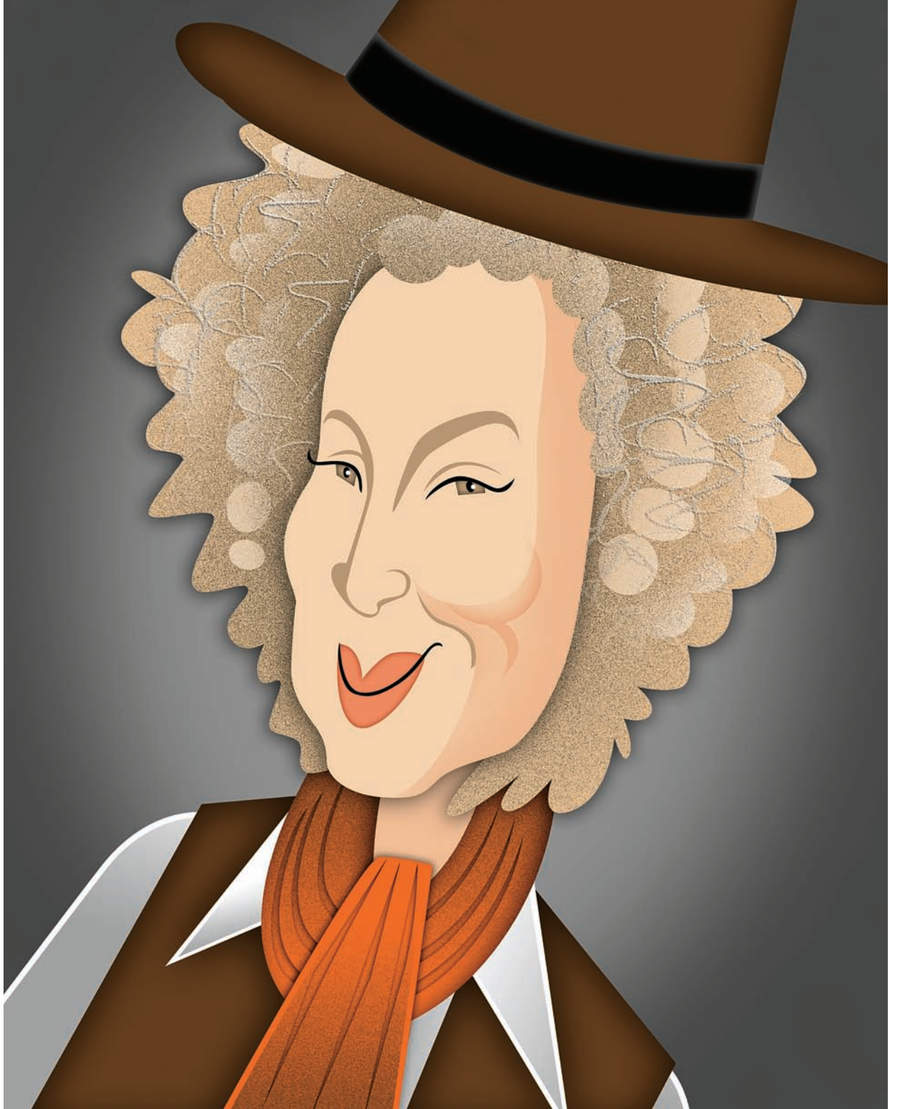
M A R G A R E T A T W O O D E S C R I T O R A