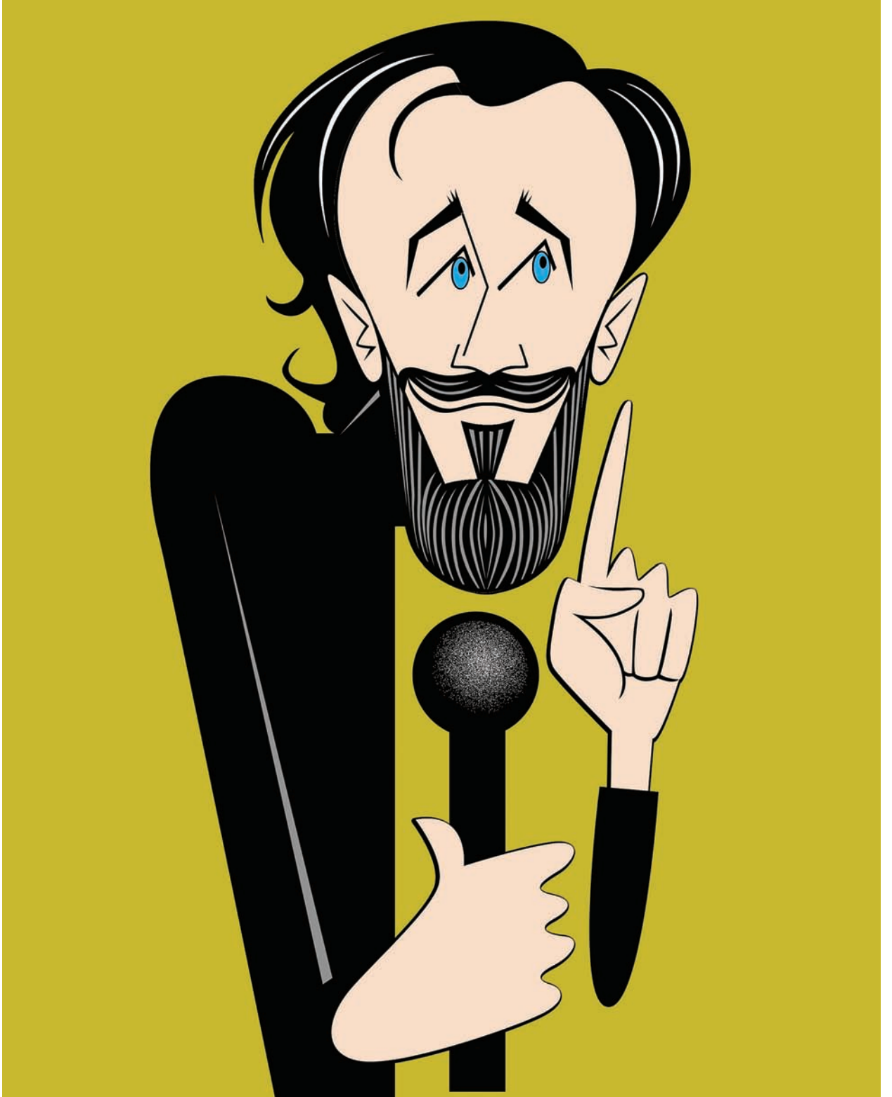
G E O R G E C A R L I N HUMORISTA