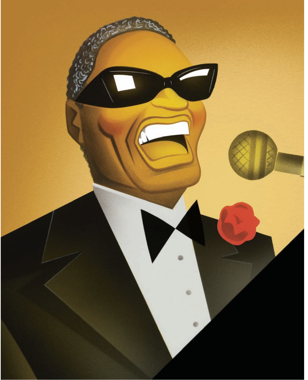
R A Y C H A R L E S MÚSICO