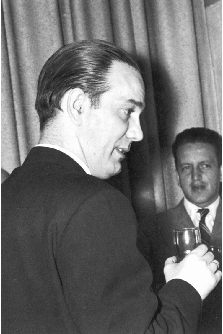
Fig. 4. Camilo José Cela conversa con Abelardo Forero Benavides, banquete en el restaurante Temel, Bogotá, mayo de 1953.