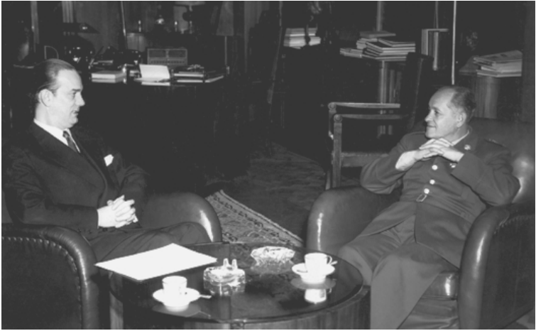
Fig. 6. Camilo José Cela entrevistando al teniente general Gustavo Rojas Pinilla, Bogotá, Palacio de Nariño, junio de 1953.

cientemente firmados con Franco, y, para concluir, añade unas palabras que son pura música para los oídos de Madrid: «Creo que el problema común que más nos pueda afectar es la defensa contra el comunismo, que amenaza los valores de la civilización cristiana, y, de un modo especial, los de la Hispanidad. España es el baluarte más avanzado y decisivo en esta lucha contra el comunismo.»