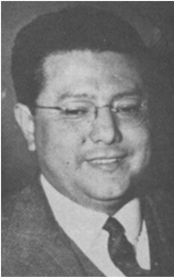
Fig. 3. Lucio Pabón Núñez, ministro de Educación de Colombia.