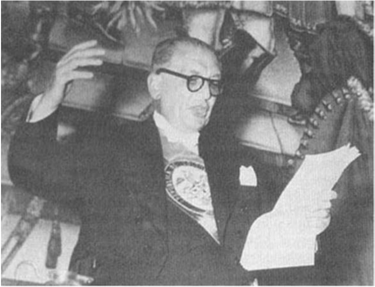
Fig. 2. Laureano Gómez toma posesión como presidente de Colombia, Bogotá, 7 de agosto de 1950.