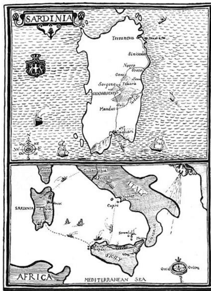
Mapa con el recorrido de D. H. Lawrence por Cerdeña, incluido en la primera edición de Sea and Sardinia

Pero regresemos a Barcelona. Una inmersión de varios meses en el mundo laboral de las prácticas en empresas me bastó para entender que yo, «pobre barquita entre olas enfurecidas» —como se calificaba a sí mismo Chíchikov, el protagonista de Las almas muertas —, estaba abocada a naufragar en aquella vorágine. También me batí el cobre en una agencia de traducción especializada en catálogos de arte y como correctora de estilo en un magacín digital que enarbolaba la chabacana bandera de la «rabiosa actualidad» y decretaba cuáles eran «LOS EVENTOS QUE NO TE PUEDES PERDER». Luego trabajé de azafata para los actos que se celebraban en el Saló de Cent del Ayuntamiento de Barcelona (donde presencié con estupefacción el despilfarro institucional). Hice lo mismo, lo de vestirme el uniforme de azafata y calzarme unos altos zapatos de salón, para ferias, congresos y eventos de todo tipo (eran épocas de buenos ingresos, incluso para quienes nos encargábamos de recibir y atender tutti quanti). Fui camarera e incluso gogó de discoteca. Hoy, cuando lo recuerdo, me pregunto con extrañeza: ¿de veras era yo?