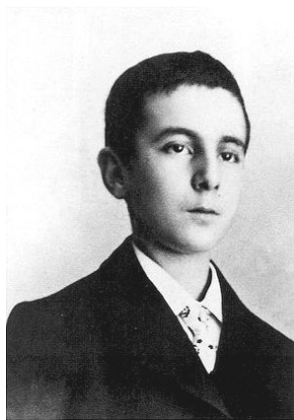
Pessoa a los trece años.