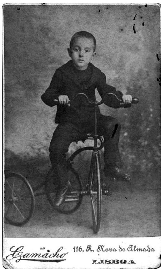
Pessoa a los seis años