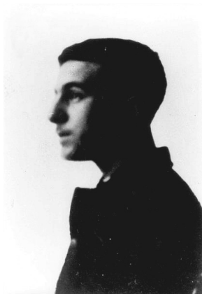
Todavía en Durban.