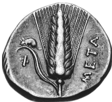
Espiga de cebada con un ratón trepando por una hoja.

Anquimolao y Mosco, sofistas que enseñaron en Élide, no bebieron en toda su vida más que agua y no se alimentaron más que de higos, pero su sudor era tan fuerte y olía tan mal que todo el mundo los evitaba en los baños. [Se cuenta que] un atleta de Tebas era superior en fuerza a todos los de su tiempo porque no comía