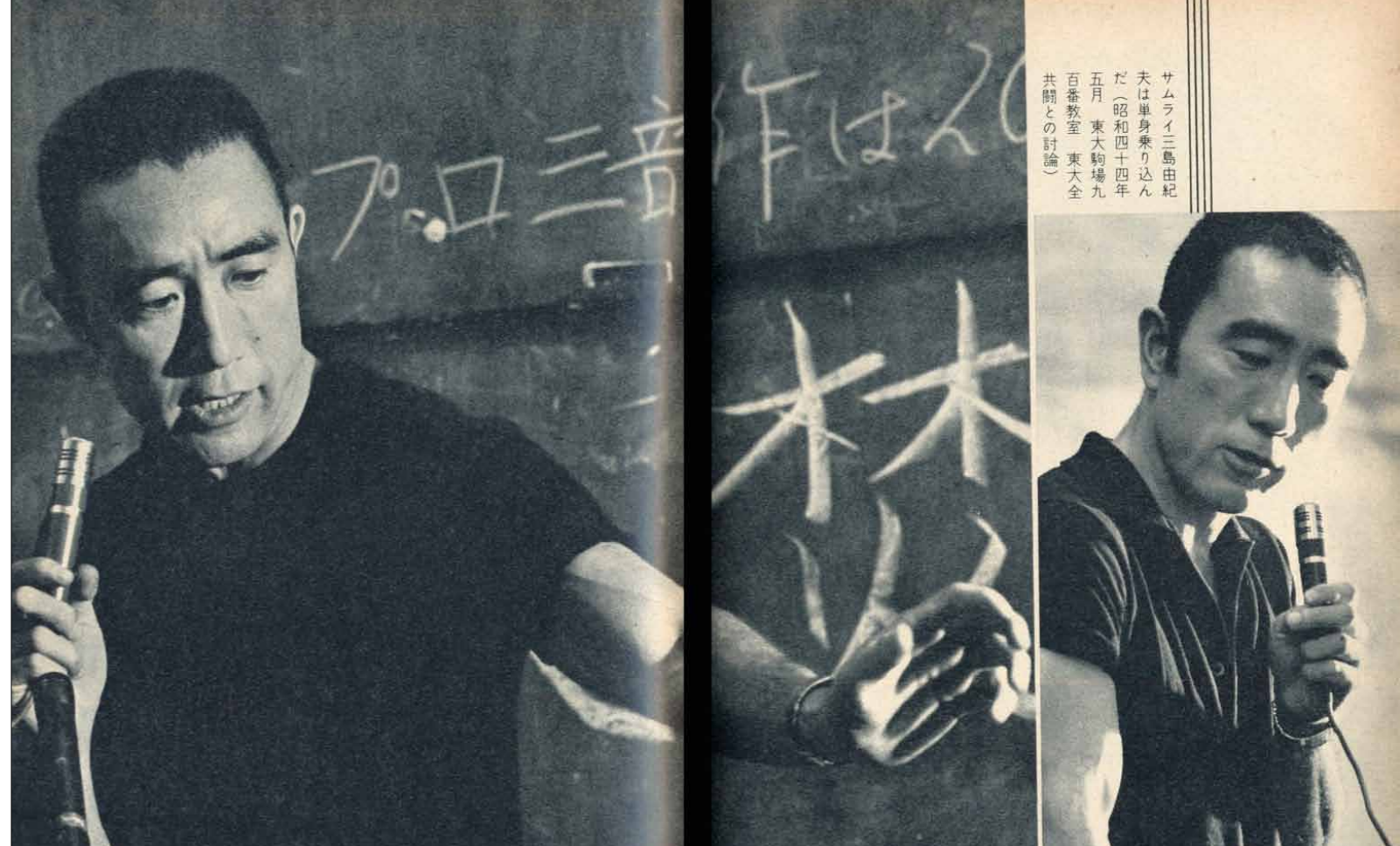
サムライ三島由紀夫は単身乗り込んだ(昭和四十四年五月 東大駒場九百番教室 東大全共闘との討論)

Es necesario conocer su infancia; habría que vivir su infancia, crecer con su inquietante abuela paterna, aristócrata mal casada, viva estampa del Japón tradicional, que se lo arrebató a la madre hasta la adolescencia. Habría que escuchar cada palabra que él escuchó de su anciana boca; leer cada poema que leyó en su compañía. Habría que haber estado cuando asistió a aquella primera pieza de Nō, primera de muchas, que la abuela le llevó a ver; habría que sentir lo que sintió el pequeño, que en pocos años se atrevería a escribir seis piezas de Nō. Tendríamos que llegar a la obsesión en ese excéntrico y celoso amor entre niño y anciana. Habría que arrodillarse en el suelo para comer y habría que curar las heridas de la abue-