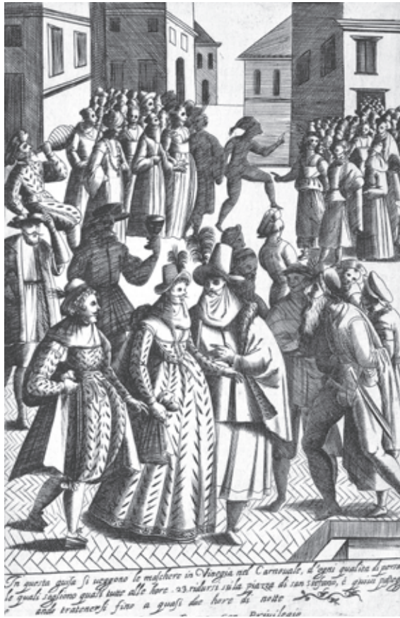
La Venecia del siglo XVII durante la temporada de carnaval.

por su agudeza financiera que por su juego, sus prostitutas y los excesos de la temporada de carnaval. En 1797, cuando las tropas de Napoleón invadieron Venecia y pusieron fin a mil años de historia como país independiente, hubo quienes vieron en ello un necesario castigo para una ciudad que se había ido haciendo cada vez más vana y decadente.