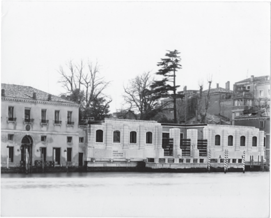
El Palazzo Venier dei Leoni a finales del siglo XX, sede de la colección de Peggy Guggenheim.