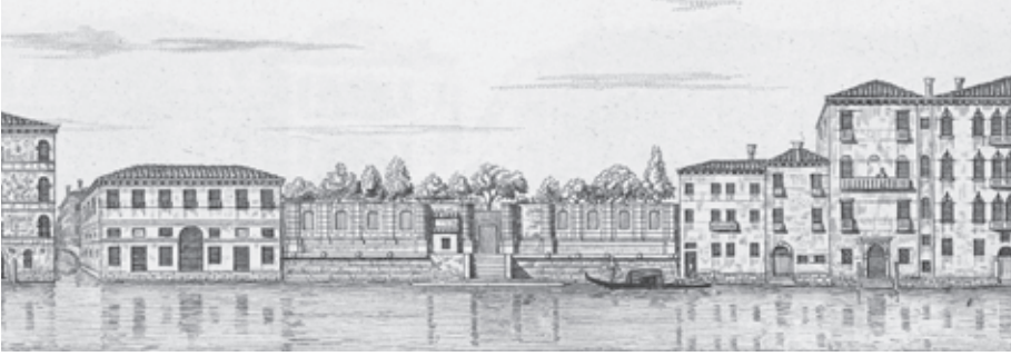
Il palazzo non finito: el malogrado proyecto de edificación de los Venier, en un grabado de 1831.

Pero en aquel punto, la construcción del Palazzo Venier dei Leoni se vio de pronto interrumpida. Se han dado muchas explicaciones al respecto, pero, como suele suceder con el folclore veneciano, ninguna se presenta con una prueba firme. Es posible que las dimensiones del edificio pudieran haber despertado finalmente una preocupación oficial y se las considerara demasiado grandes, demasiado inestables para aquel lugar en particular; 2 es igualmente posible que los Venier hubieran estirado demasiado sus finanzas y, a causa de algún mal negocio o de un pleito perdido, se hubieran visto incapacitados para continuar la construcción tal y como estaba planeada. Se dice también que las ambiciones dinásticas de la familia se habían venido abajo al no poder forjar una nueva generación de hijos y herederos. Fuera cual fuese la razón, cuando Nicolò Venier murió, en 1780, aquel enorme plan se vio malogrado y el edificio quedó sin terminar, muy lejos de las dimensiones originalmente proyectadas: solo una planta de alto y dos habitaciones de fondo. En lugar de ser un monumento al nombre de la familia, pronto sería conocido burlescamente como il palazzo non finito («el palacio inacabado»).