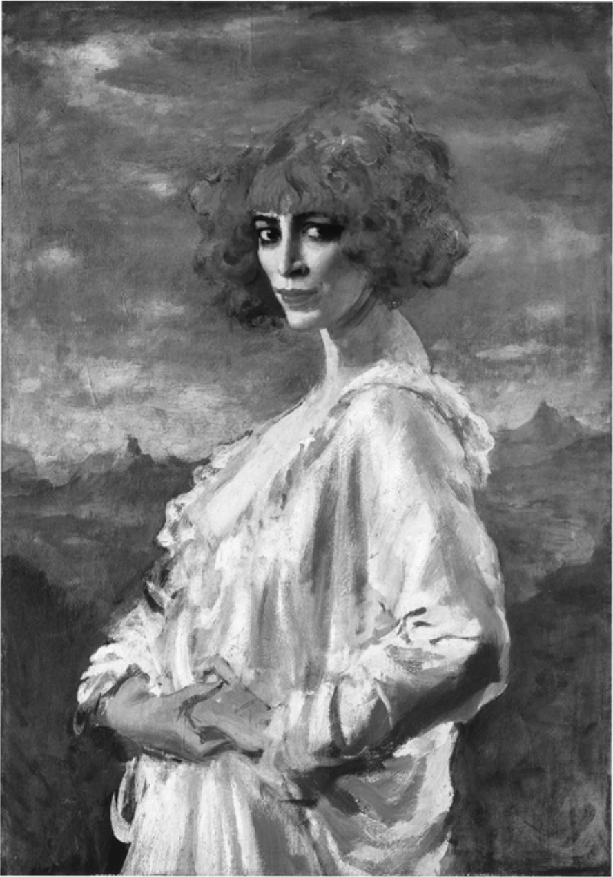
Luisa Casati pintada por Augustus John (1919).