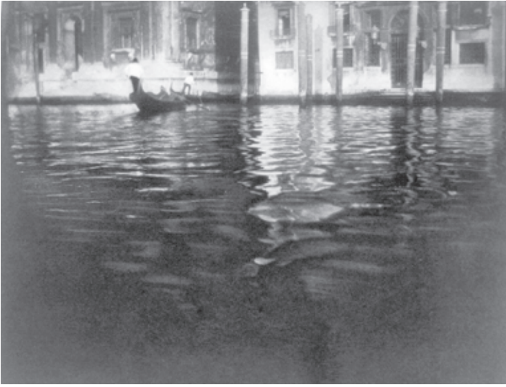
«Una ciudad suspendida en el mar»: Venecia fotografiada en 1913.