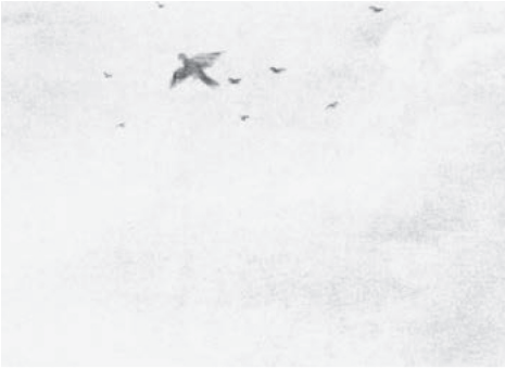
«Pájaro», detalle de Paisaje de invierno, de Avercamp.

congelaba en los toneles; en la Europa oriental, a los pájaros les ocurría lo mismo en pleno vuelo y caían al suelo, y una alta capa de nieve llegó a cubrir zonas de Italia y España. Europa era un imperio helado.