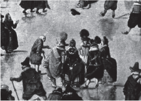
«Grupo con mendigo», detalle de Paisaje de invierno, de Avercamp.

Hendrick Avercamp (1585-1634), el creador de ese paisaje, se especializaba en escenas invernales. Las pintaba todo el año en su estudio de Ámsterdam y, más tarde, en Kampen. Los personajes alegres y desinhibidos de sus cuadros, que disfrutaban sin sentir en absoluto el frío, expresaban los anhelos del artista, que era sordomudo y vivía con su madre apartado del mundo. Avercamp murió pocos meses después de morir ella. El feliz frenesí que pintaba era, siempre, la vida de los otros.