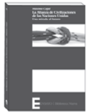
La Alianza de Civilizaciones de las Naciones Unidas. Una mirada al futuro MÁXIMO CAJAL