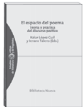
El espacio del poema. Teoría y práctica del discurso poético ITZIAR LÓPEZ GUIL y JENARO TALENS (Eds.)