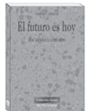
El futuro es hoy. Da sabiduría a los años ISABEL CABETAS