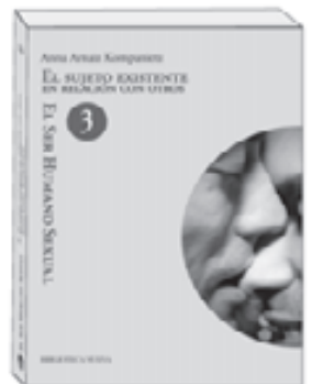
El ser humano sexual III. El sujeto existente en relación con otros ANNA ARNAL KOMPANIETZ